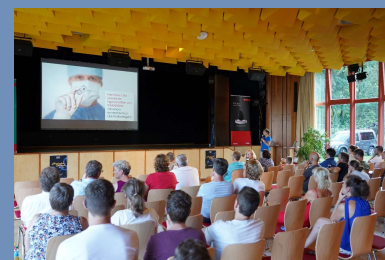
CI info day